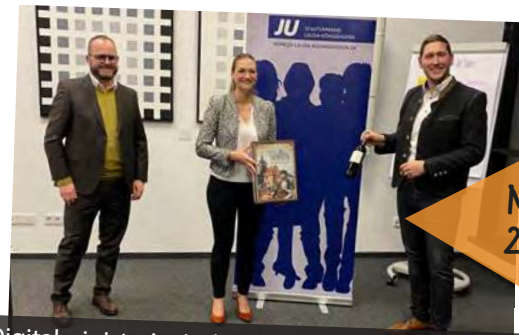
Digitalministerin Judith Gerlach MdL im November 2021 auf Einladung der Jungen Union zu Gast bei der Firma LAUDA; Thema Digitalisierung