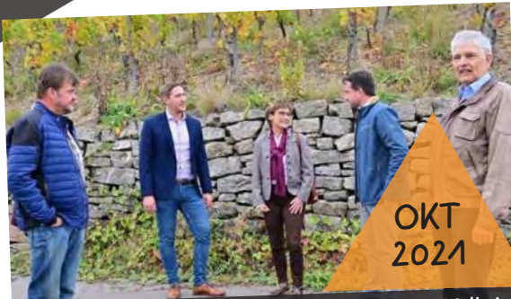
Besuch der Staatssekretärin Sabine Kurtz MdL im Oktober 2021 in Beckstein; Schwerpunkt Landwirtschaft und Weinbau